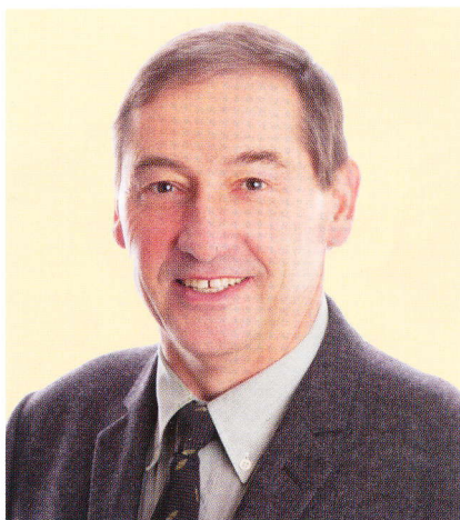
Dieter Gemeinhardt 1. Bürgermeister Issigau