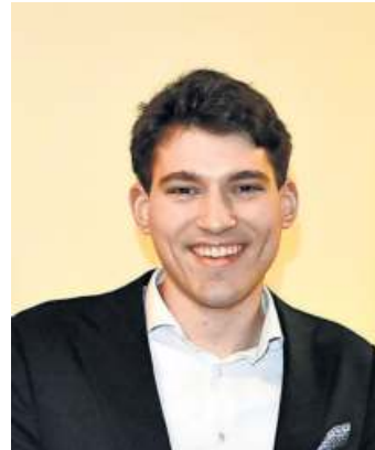
MdL Kristan von Waldenfels

nen zur Waldhauptstadt. Er verweist auf die Herausforderungen der Region mit Wirtschaft, Wald, Wasser oder Mobilität. Hierfür wurden und werden die Weichen gestellt. MdL Kristan von Waldenfels ist beeindruckt von der Waldhauptstadt, zu der auch Landwirtschaft und Tourismus gehören. Diese Verbindung sollte überall zusammengebracht