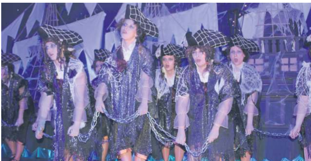
Die Prinzengarde lag bei ihrem Schautanz in Ketten und zeigten in ihren tollen Kostümen einen perfekten Tanz.