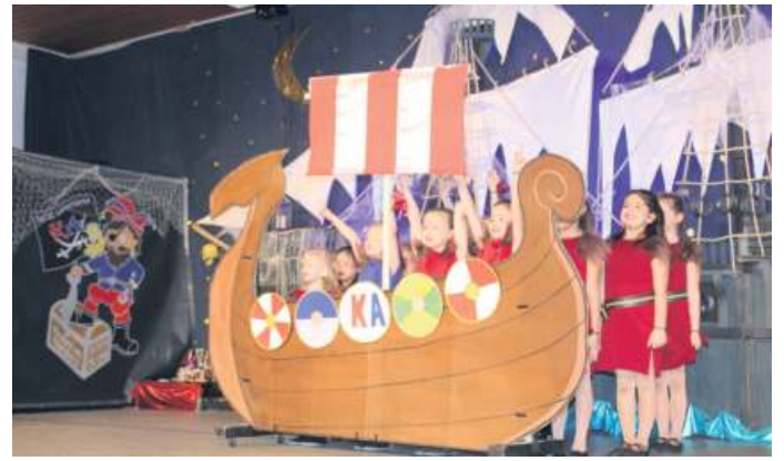
Die Minigarde meisterte den lustigen Tanz von „Wiki und den starken Männern“ auf hoher See und erhielt großen Applaus.