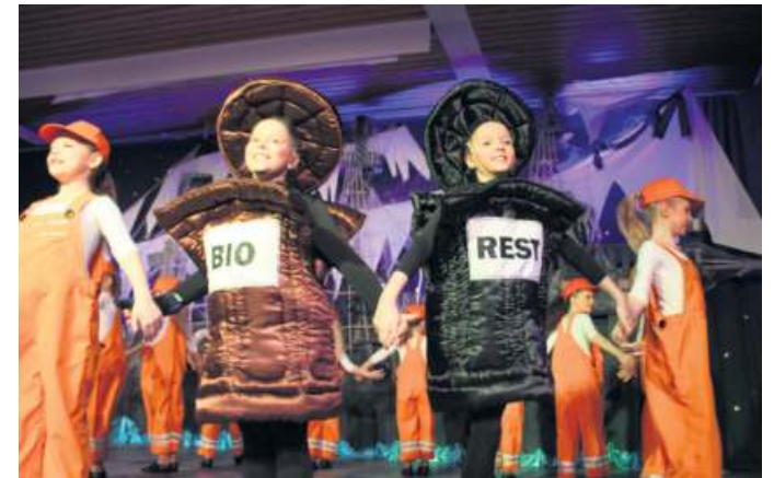
Die starke Jugendgarde zeigte den Turnier-Schautanz zum Thema „Mülltrennung“ in gekonnter Weise.