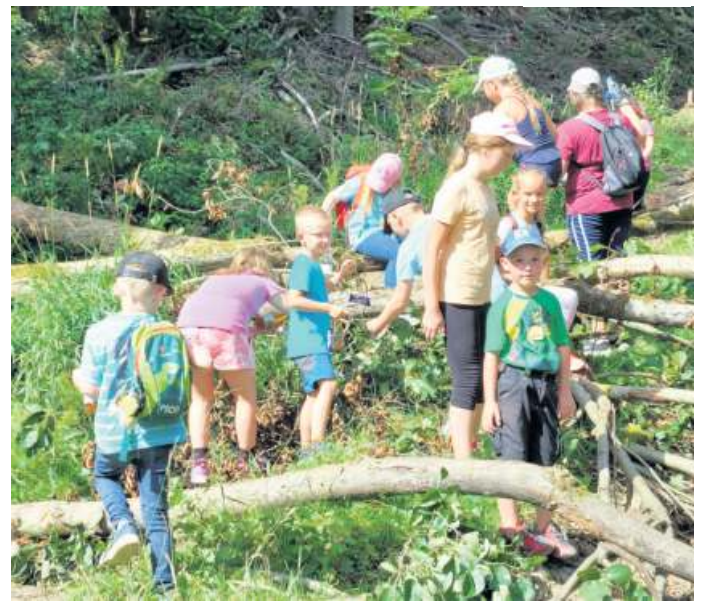
Auf einer Wanderung durch den Wald erkundeten die Kinder die dortigen Naturbegebenheiten.

Eingebunden in die Aktionen des Ferienprogramms der Gemeinde Geroldsgrün hatte sich auch die Ortsgruppe Dürrenwaid des Frankenwaldvereins. Zwanzig Kinder zwischen vier und zwölf Jahre sind dabei der Einladung, die unter der Devise „Ich glaub mein Wildschwein pfeift“ stand, gefolgt. Treffpunkt war das Grundstück von Alt-Bürgermeister Helmut Oelschlegel im Langenbachtal. Hier wurde den Teilnehmern anhand von Präparaten unter anderem die Tiere Fuchs, Dachs, Marder und Eichhörnchen näher erklärt. Diese Geschöpfe wurden von der Kreisjägerschaft Naila dankenswerterweise zur Verfügung gestellt. Gebastelt wurde von den Kindern ein Wildschwein aus Fichtenzapfen und einem Eierkarton. Bei der Zwei-Kilometer-Wanderung auf einem Jägersteig wurde die Natur unter dem Motto „Was hörst du, was fühlst du“ erkundet. Am Ende des rund fünfstün-