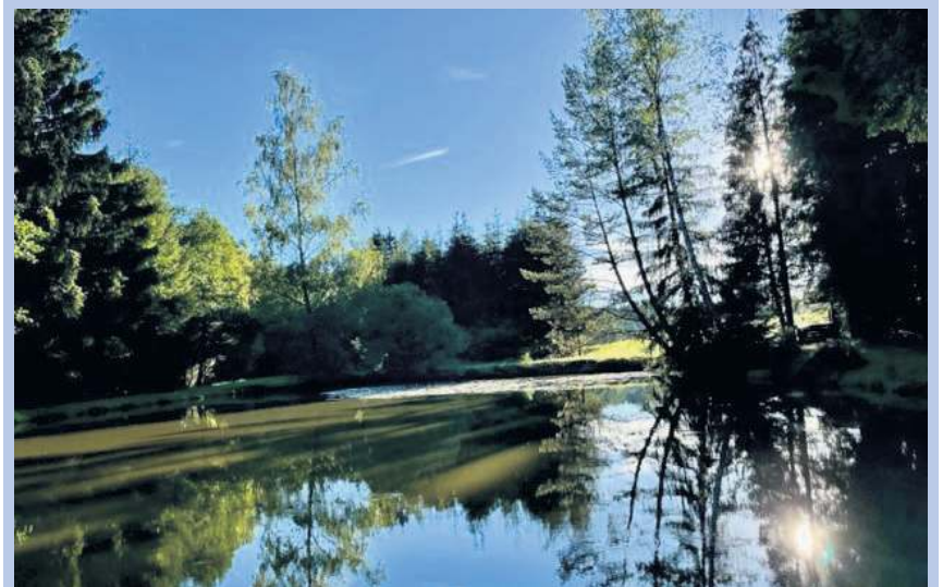
Eine wunderschöne Naturspiegelung bei einer Radtour am Abend hat Sabine Eberlein aus Bobengrün fotografiert.