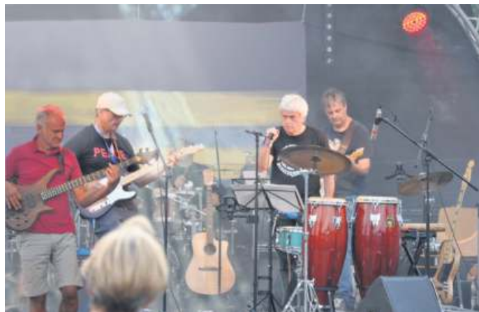
Die Band Nebelschwade.