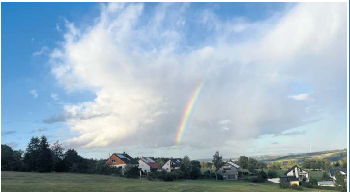
... fotografiert von WIR-Leserin Sylvia Mahall.