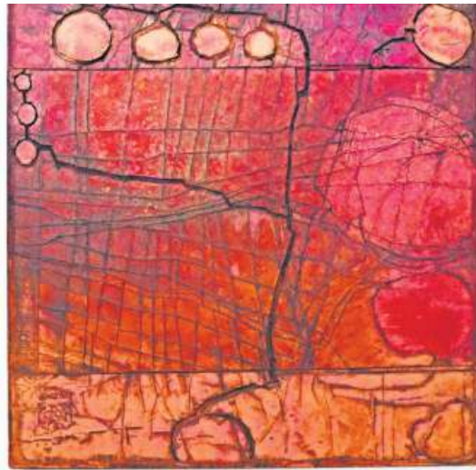
Gerd Kanz, Kiss me over the garden gate, 2020, Öl auf Holz, 80 x 80 cm.

Einmalig und unverwechselbar ist das Werk des unterfränki-