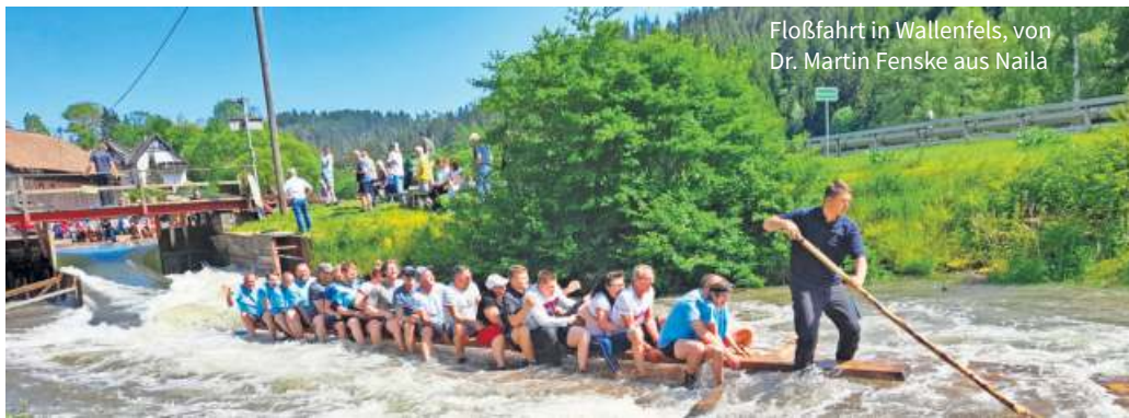
Floßfahrt in Wallenfels