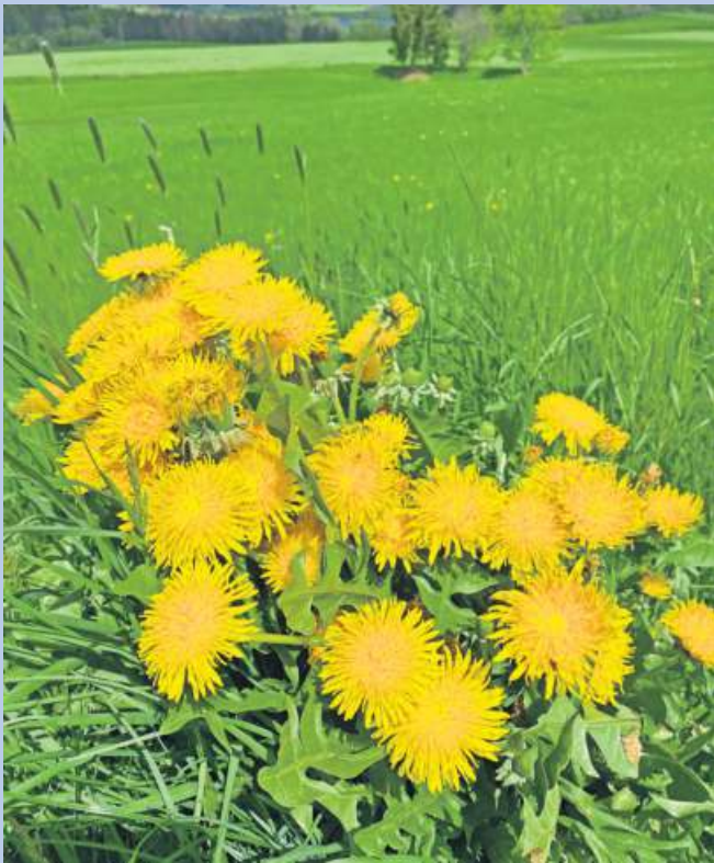
Goldgelb blüht der Löwenzahn, gemalt von Gerda Kübrich