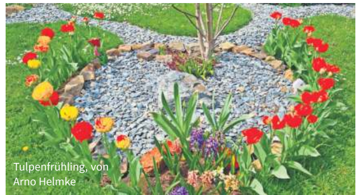
Tulpenfrühling, von Arno Helmke