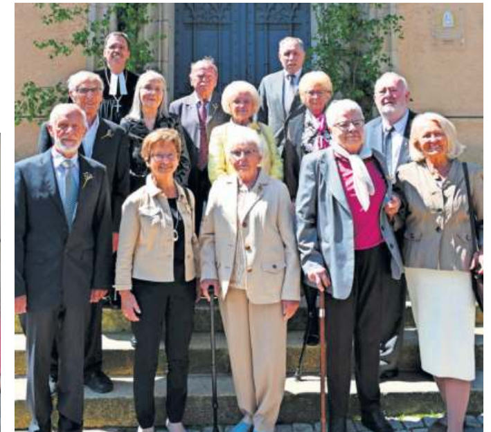
An der Gnadenjubelkonfirmation und somit nach 70 Jahren nahmen 13 Frauen und Männer teil.