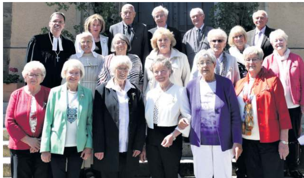
Die Eiserner Konfirmation und somit nach 65 Jahren feierten 16 Frauen und Männer.