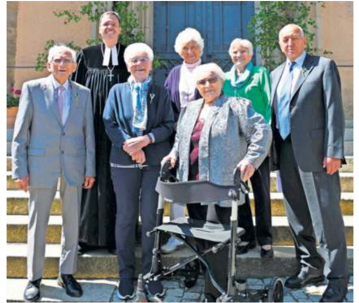
Vier Frauen und zwei Männer feierten nach 75 Jahren ihre Kronjuwelen Konfirmation.

Mit einem Festgottesdienst gedachten Frauen und Männer in der Nailaer Stadtkirche ihrer grünen Konfirmation und feierten gemeinsam mit Dekan Andreas Maar sowie Familie und Freunden das Fest der Kronjuwelen Konfirmation, der Gnadenkonfirmation, der Eisernen, Diamantenen und Goldenen Jubelkonfirmation. Den Gottesdienst umrahmte Karlheinz Jahn musikalisch mit seinem Orgelspiel. 25 Frauen und Männer feierten nach 50 Jahren ihre Goldene Konfirmation.