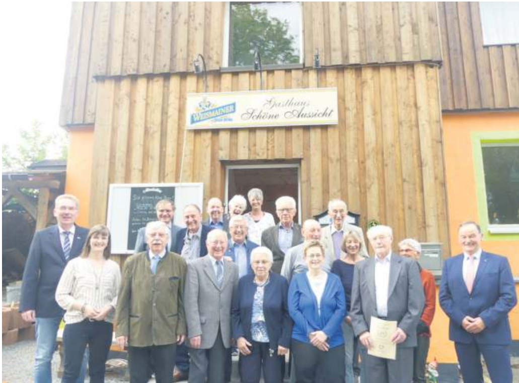
A Große Feier zum 25-jährigen Jubiläum des Reha-Sportvereins Bad Steben.