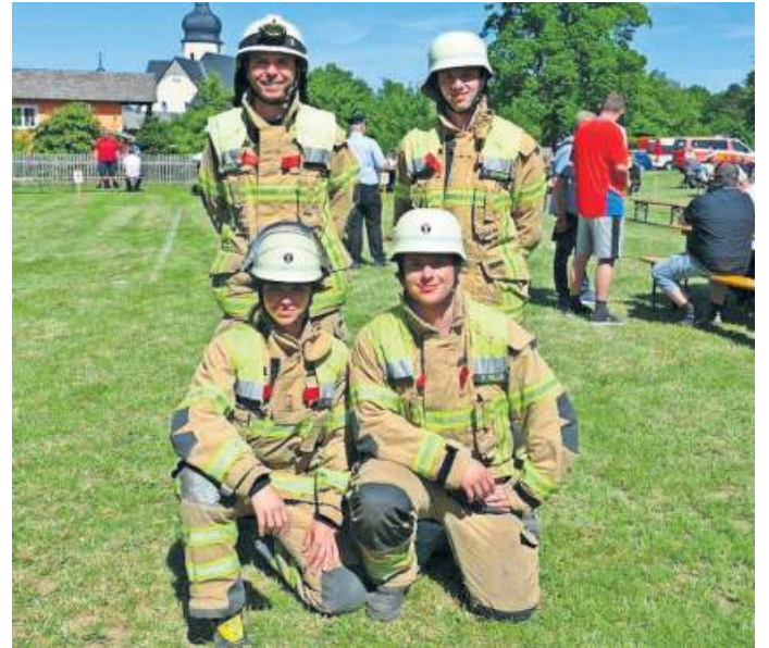
Das Siegerteam des Kuppelcups.