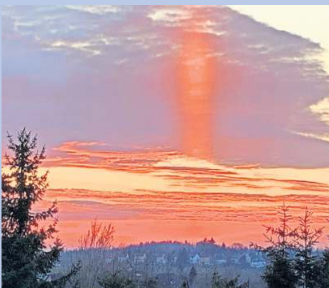
Beeindruckender Sonnenaufgang.