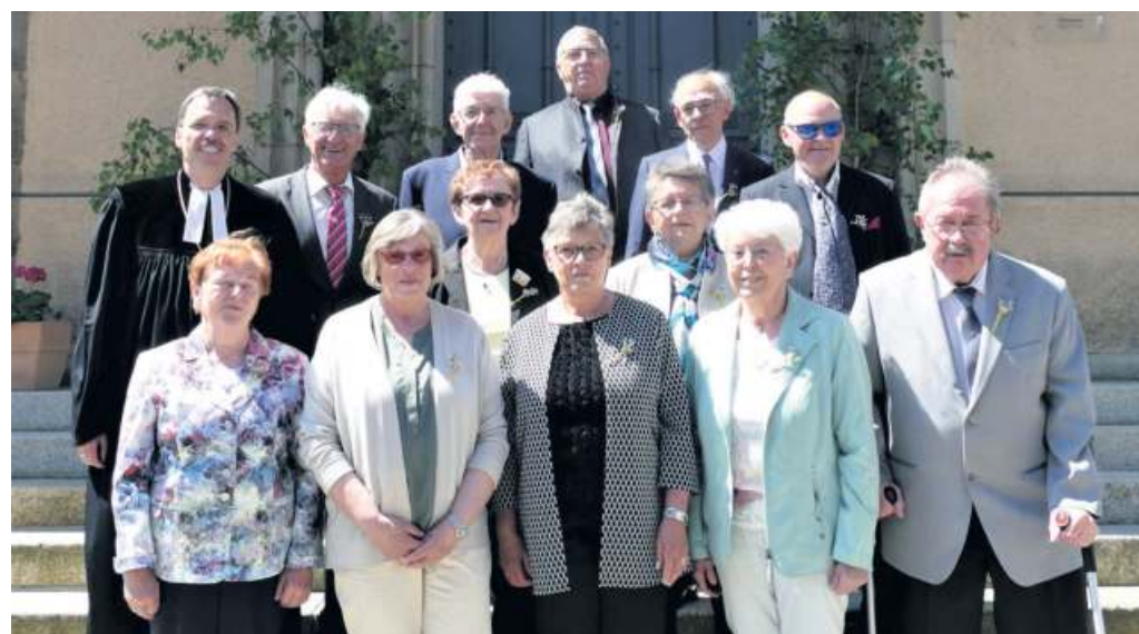
Zwölf Frauen und Männer feierten gemeinsam nach 60 Jahren die Diamantene Konfirmation.