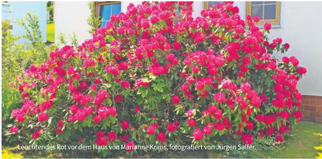
Leuchtendes Rot vor dem Haus von Marianne Kraus.

Die WIR-Redaktion bedankt sich für die tollen Fotos, die uns unter der E-Mail-Adresse redfrankenwald@kurier.de erreicht haben. An dieser Stelle zeigen wir einige Fotos, die bis jetzt noch nicht veröffentlicht werden konnten.