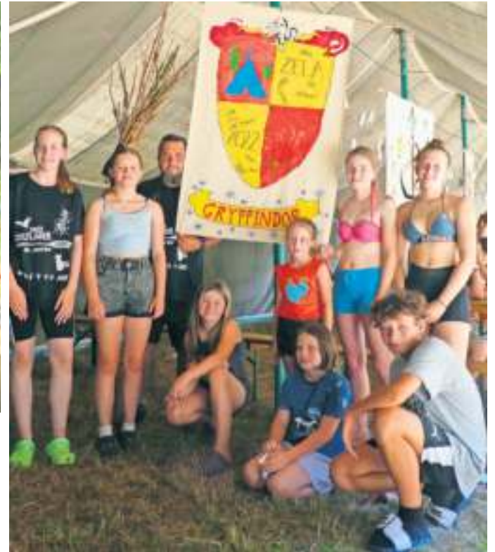
Mitglieder eines der vier ‚magischen‘ Häuser mit ihrem selbstgestalteten Banner.