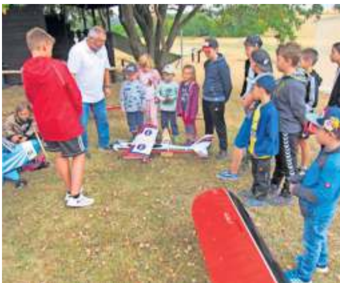
Hochbetrieb an den Modellflugsimulatoren.