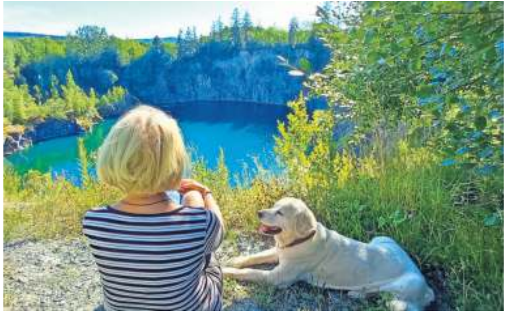
Idylle am Baggersee