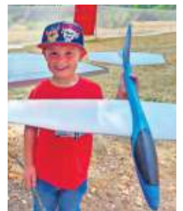
Auch die Jüngsten konnten Flugtechnik ausprobieren.