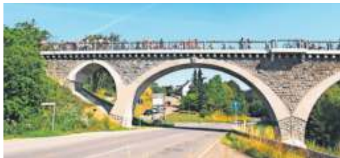
Die Bogenbrücke in Naila ist beim Tag des offenen Denkmals dabei.

Die Eisenbahnbrücke über das Selbitztal ist Bestandteil des Geh- und Radweges auf der ehemaligen Bahnlinie zwischen dem Bahnhof Naila und Schwarzenbach a. Wald und damit jederzeit frei zugänglich. Einstiegsmög-