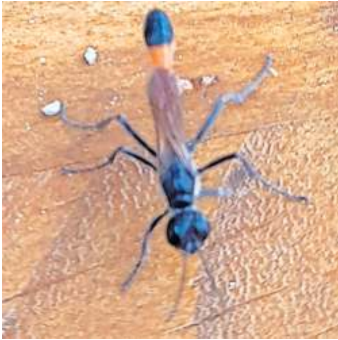
Eine Riesenholzwespe, fotografiert von Sabine Pavlista aus Marlesreuth

Die WIR-Redaktion bedankt sich für die vielen beeindruckenden Bilder, die Sie uns an die E-Mail-Adresse redfrankenwald@kurier.de schicken. Auf dieser Seite präsentieren wir einige der Bilder, die es bislang noch nicht ins Blatt geschafft haben.