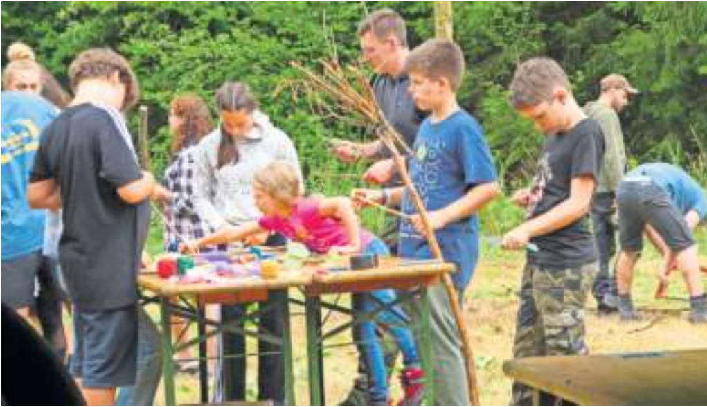
Zeltlagerteilnehmer beim Basteln und Schnitzen am Montag.

Nach einer zweijährigen Coronapause fieberte die katholische Jugend Naila/Selbitz ihrem jährlichen Sommerzeltlager entgegen. In der ersten Ferienwoche war es dann endlich soweit: Vom 31. Juli bis 06. August verbrachten über 50 Kinder und Jugendliche im Alter von 8 bis 16 Jahren und Gruppenleiter verschiedener Konfessionen gemeinsam bei Steinwiesen eine abwechslungsreiche Zeit bei bestem Sommerwetter.