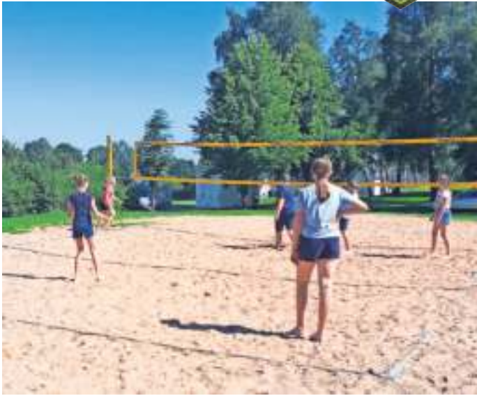
Döbra – Die Jugendgruppe des Frankenwaldvereins Döbra war zu Beginn der Sommerferien in Wüstenselbitz am See und hat den Tag mit Beachvolleyball und Völkerball im Sonnenschein verbracht.