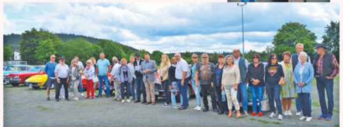
Über 60 Teilnehmer waren mit 32 Oldtimern unterwegs