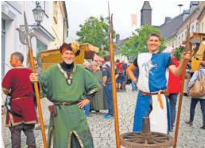
Bei „24 Stunden Frankenwald erleben“ kann jeder sein Wunschprogramm selbst zusammenstellen.

Und das Schöne dabei ist: Jeder kann sein Wunschprogramm vorab selbst im Internet zusammenstellen und dabei aus einem bunten Potpourri aus sehens- und erlebniswerten Erlebnismöglichkeiten verteilt über den gesamten Frankenwald wählen. Und dann kann es losgehen am ersten September-Wochenende. Dann erfahren Besucher hautnah, wie spannend, authentisch, naturnah und lecker der Frankenwald ist und unternehmen zum Beispiel eine geführte Sonnenaufgangswanderung, backen ihre eigene Frühstücksbrezel, erkunden den Botanischen Garten in Hof bei der verheißungsvollen Führung „Flotte Frauen und Blümchen-