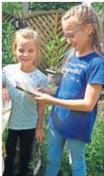
Nea freut sich mit ihrer Schwester über den Preis!