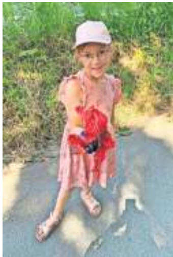
Nea mit Müll in der Hand

-beim nächsten Spaziergang eine leere Tüte mitnehmen, -doch vielleicht noch viel wichtiger – selber darauf achten, Müll zu vermeiden, indem man auf Verpackungen verzichtet, bzw. diese zuhause in die entsprechenden Tonnen entsorgt!