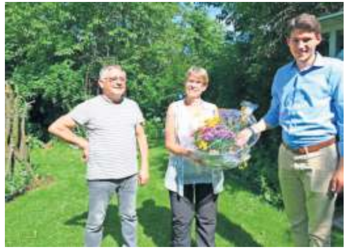
Bürgermeister Kristan von Waldenfels (rechts) überreichte einen Strauß bunter Blumen und dankte für das Engagement des Ehepaars mit dem „grünen Daumen“.