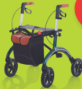
CARBONROLLATOR Extrem leicht