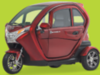
ECONELO F1 Kabinenroller Führerscheinfreies Fahren