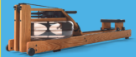
NOHRD WATERROWER Fitness Rudergerät