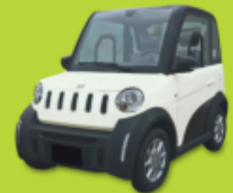
MICAN Fahrbar ab 15 Jahren