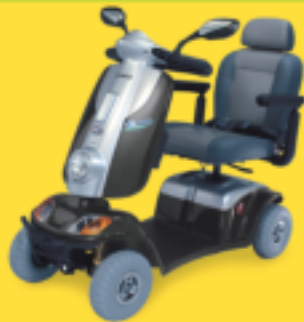
POEL FOR U ÖPNV-tauglich