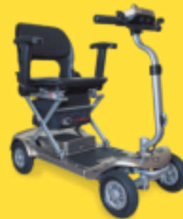
MINISCOOTER Elektrisch faltbar