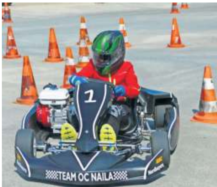
36 Mädchen und Jungen waren beim 16. Jugendkart-Slalom des OC Frankenwald.Naila am Start.