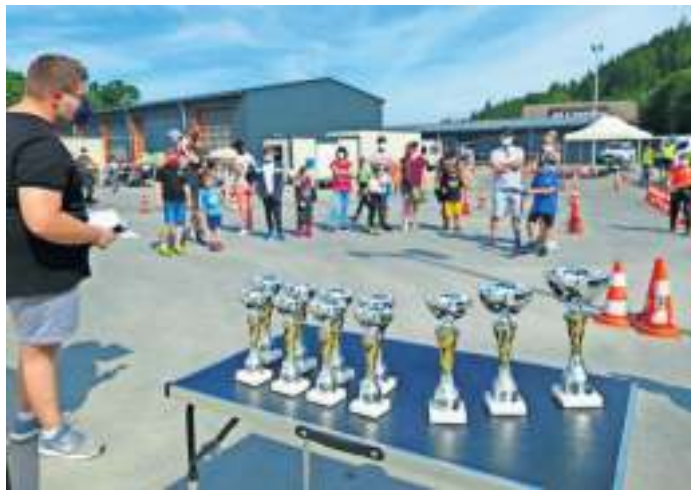
Ein Blick auf die zahlreichen Pokale, die es beim 16. Jugendkart-Slalom des OC Frankenwald.Naila zu gewinnen gab.