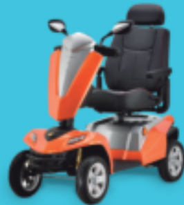
TEXEL Der Allrounder