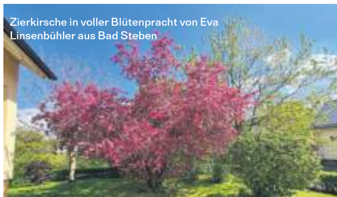
Zierkirsche in voller Blütenpracht von Eva Linsenbühler aus Bad Steben

Die WIR-Redaktion bedankt sich für die vielen beeindruckenden Bilder, die Sie uns an die E-Mail-Adresse redfrankenwald@kurier.de schicken. Auf dieser Seite präsentieren wir einige der Bilder, die es bislang noch nicht ins Blatt geschafft haben.