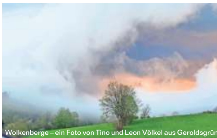
Wolkenberge – ein Foto von Tino und Leon Völkel aus Geroldgrün