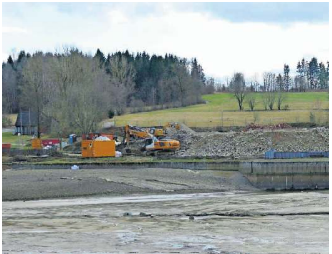
Die Fotos zeigen die wachsenden Berge von Recycling-Betonabbruch, die wieder verwendet werden.

des begonnen werden. Eine parkähnliche Gestaltung für ein Naherholungsgebiet steht auf dem Plan. In der jüngsten Stadtratssitzung hatte Planer Christian Schnabel vom gleichnamigen Büro aus Konradsreuth nicht nur die Pläne rund um den Frankwaldsee erläutert, sondern auch, dass man das noch verbliebene Abbruchmaterial über eine Brechanlage aufbereitet und dieses dann als Recycling-Betonabbruch bei der Neugestaltung wieder einarbeiten wird. Nun ist die umfangreiche Maschinerie wie ein Bagger mit Specht vor Ort und auch die Brechanlage vor Ort und es geht zügig vorwärts. Das Wachsen der Berge ist täglich zu sehen. Übrigens steht auch der Ausbau des Betonpflasters, -mauern und der Palisaden im Uferbereich noch aus. Mit dem Anlegen eines naturnahen Ufers, dass einen flachen Zugang in den See bieten wird, vergrößert sich übrigens auch die Wasserfläche.