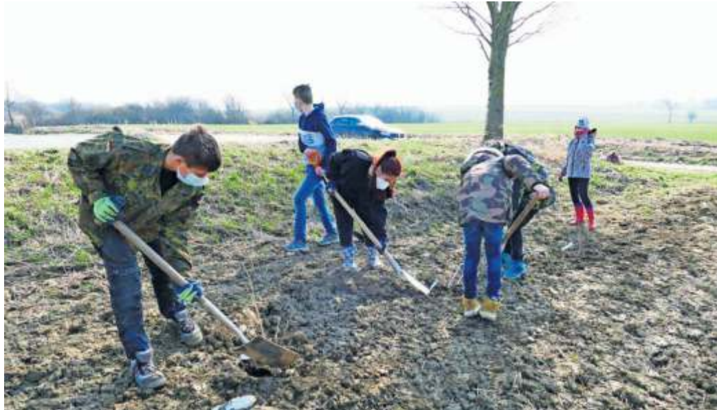
Start beim Erdkinderplan frei nach Maria Montessori an der Freien Montessori-Volksschule in Berg für die Fünftklässler mit dem Pflanzen einer Esshecke.