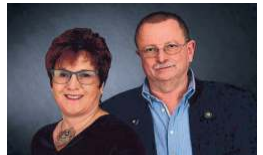
Kompetent und freundlich werden Sie beim Möbelhaus Dietz in Nordhalben beraten. Familie Dietz ist immer gerne für Sie da!

Neben dem "normalen" Sortiment eines Möbelhauses können wir mit unserer eigenen Polsterwerkstatt auch Neubezüge, Aufpolsterungen, Reparaturen und den Verkauf