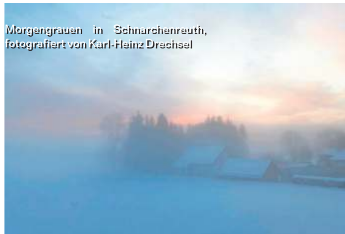
Morgengrauen in Schnarchenreuth, fotografiert von Karl-Heinz Drechsel

Die WIR-Redaktion bedankt sich für die vielen beeindruckenden Bilder, die Sie uns an die E-Mail-Adresse redfrankenwald@kurier.de schicken. Auf dieser Seite präsentieren wir einige der Bilder, die es bislang noch nicht ins Blatt geschafft haben.