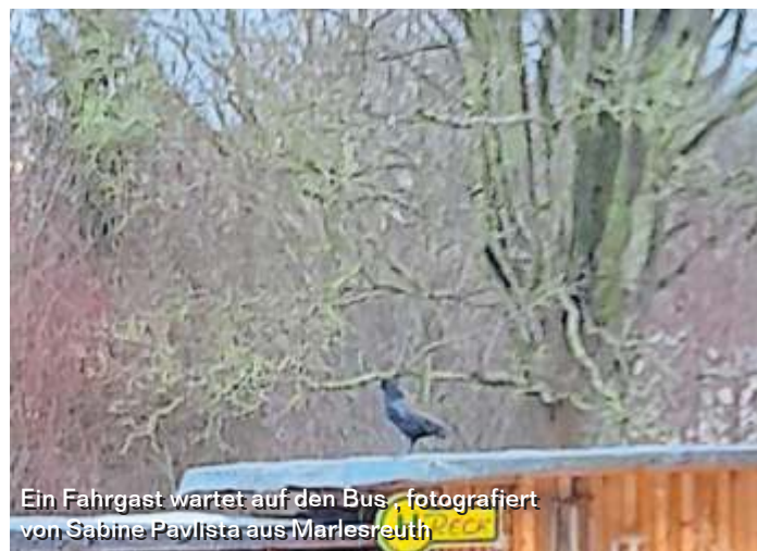
Ein Fahrgast wartet auf den Bus, fotografiert von Sabine Pavlista aus Marlesreuth