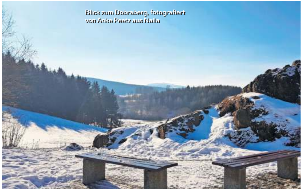
Blick zum Döbraberg, fotografiert von Anke Peetz aus Naila