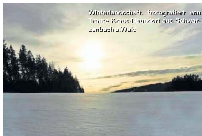
Winterlandschaft, fotografiert von Traute Kraus-Naundorf aus Schwarzenbach a. Wald