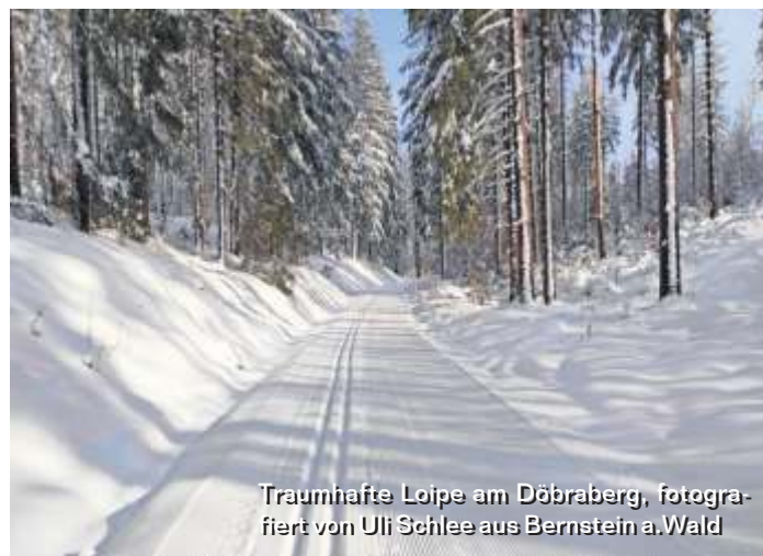
Traumhafte Loipe am Döbraberg