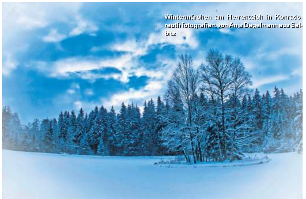
Wintermärchen am Herrenteich in Konradsreuth