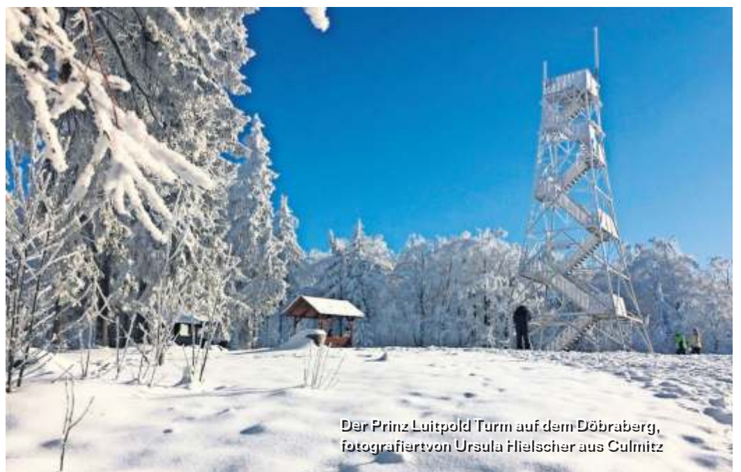
Der Prinz Luitpold Turm auf dem Döbraberg, fotografiert von Ursula Hlischer aus Culmitz