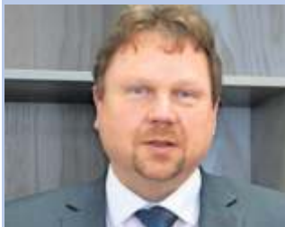
Bürgermeister Reiner Feulner: „Die Sozialstation ist ein Gewinn für unsere Stadt“