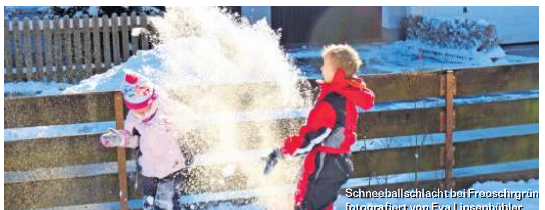
Schneeballschlacht bei Freoschrün