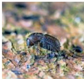
Der Borkenkäfer sorgt für große Schäden in Bayerns Wäldern

Waldbesitzer beantwortet der örtlich zuständige Revierleiter der bayerischen Forstverwaltung.