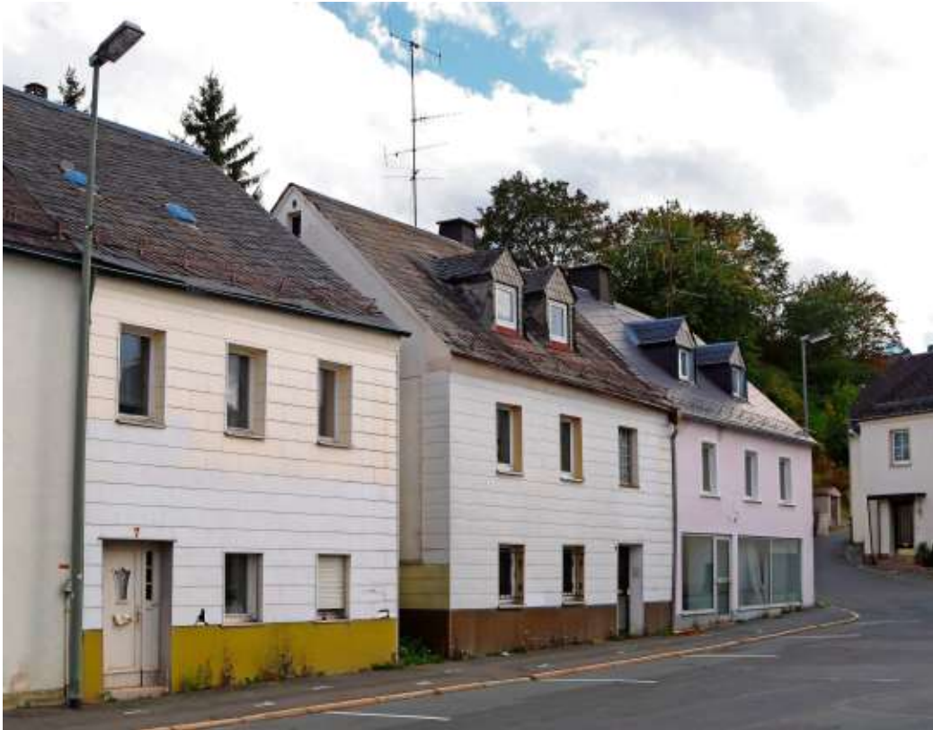
Beispiel Mühlstraße: hier sollen zeitgemäße Wohnungen entstehen. Die zentrale und trotzdem ruhige Lage macht dieses Quartier für Familien genauso attraktiv wie für junge Menschen oder für Senioren. Ein klares und attraktives Konzept soll bei der Suche nach dem richtigen Investor helfen.