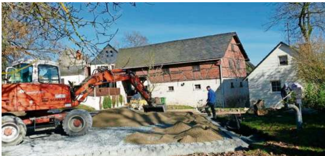
Auf der gegenüberliegenden Seite des Dorfgemeinschaftshauses hat das Kriegerdenkmal einen neuen Platz gefunden und vier Parkplätze entstehen.

Die CSU Berger Winkel gibt auch für 2021 den beliebten Veranstaltungskalender für den Berger Winkel heraus. Obwohl wegen der aktuellen Corona-Lage völlig unklar ist, ob und welche Veranstaltungen im nächsten Jahr durchgeführt werden können, bitten wir die Vereine und Organisationen um Meldung der Termine für das nächste Jahr bis zum 15. November an: patricia.rubner@gmx.de