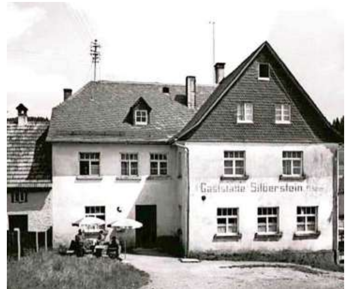
Der Silbersteiner Jahreskalender 2021 zeigt im November eine Aufnahme aus dem Jahre 1960 von der einstigen „Gaststätte Silberstein“.

„Aus der Heimat - für die Heimat, interessant, ansprechend, nachhaltig, günstig“, mit diesen Worten könnte man eine Aktion der Interessengemeinschaft Silberstein umschreiben. Diese Gemeinschaft hat sich vor einigen Wochen aus Anlass des 100-jährigen Bestehens, das im nächsten Jahr ansteht, ihres zur Gemeinde Geroldgrün gehörenden Ortsteils gegründet. Bei der erwähnten Aktion handelt es sich um einen Jubiläums-Jahreskalender für 2021, der