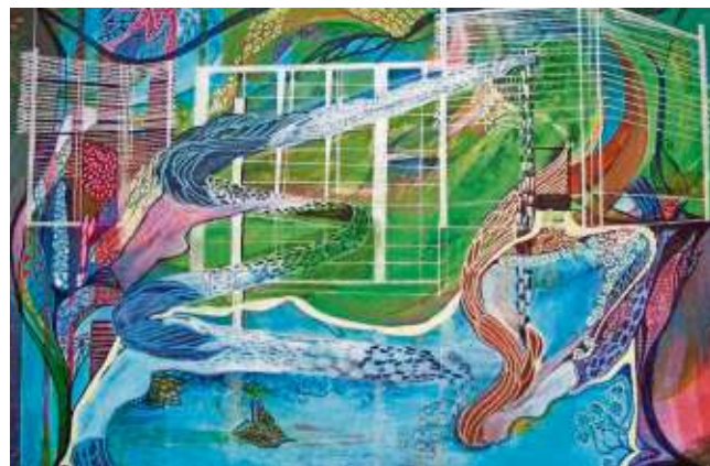
Die Bilder von Dorothea Leist: „Jugendstil-Idyll in Bad Steben“ und „Leuchtrosette der katholischen Kirche in Bad Steben“.