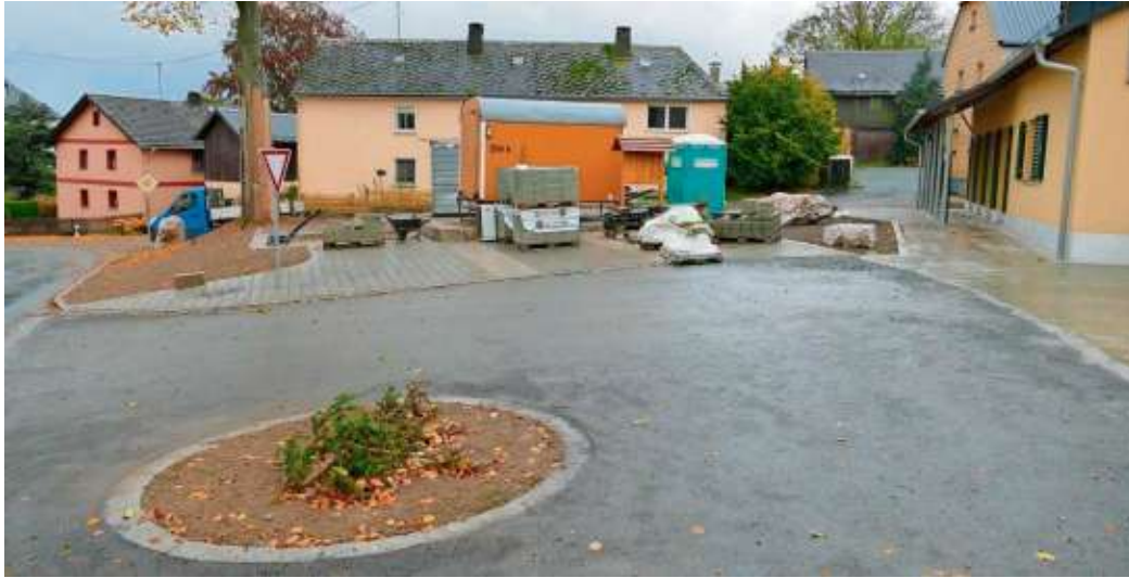
Im Rondell soll ein Baum gepflanzt werden, da das dörfliche Leben geschützt werden soll und der Verkehr trotzdem fließen kann.

Die Vorplatzgestaltung beim Dorfgemeinschaftshaus im Berger Ortsteil Bug befindet sich auf der Zielgeraden, die Abnahme steht unmittelbar bevor und somit ist auch der Bauzeitenplan eingehalten worden. Bürgermeisterin Patricia Rubner spricht schmunzelnd von einem „Multifunktionsplatz“, der vielerlei Möglichkeiten bietet und verweist darauf, dass das Dorfgemeinschaftshaus das einzige Veranstaltungsgebäude im Berger Winkel mit kompletter Barrierefreiheit ist, vom Parkplatz beginnend über den Eingang bis hin zu den Sanitäreinrichtungen. „Übrigens steht das Dorfgemeinschaftshaus nicht nur den Bugern und Bruckern, sondern allen Bürgerinnen und Bürgern, den heimischen Vereinen und allen Organisationen zur Verfügung“, betont die Bürgermeisterin und erinnert beispielsweise an die Nutzung durch die Kirchengemeinde Berg für die Männerabende. Die Fläche bietet mittig auf dem angelegten Schotterterrasenplatz ausreichend Platz für einen Zeltaufbau. Bürgermeisterin Rubner lobt die bauliche Umsetzung trotz der Schwierigkeiten mit abfallendem Gelände und unterschiedlichem Höhenniveau. „Die terrassenförmig angeordneten Granitstufen passen sich hervorragend ein.“ Die Flächengestaltung an sich wird durch die Verwendung unterschiedlicher Materialien aufgelockert. „Es kommt sowohl Asphalt zum Einsatz wie auch das Berger-