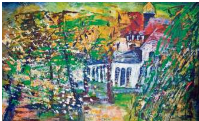
Die Bilder von Yvonne Bressel: „Herbst in Bad Steben“ und „Ein Tag in der Therme Bad Steben“