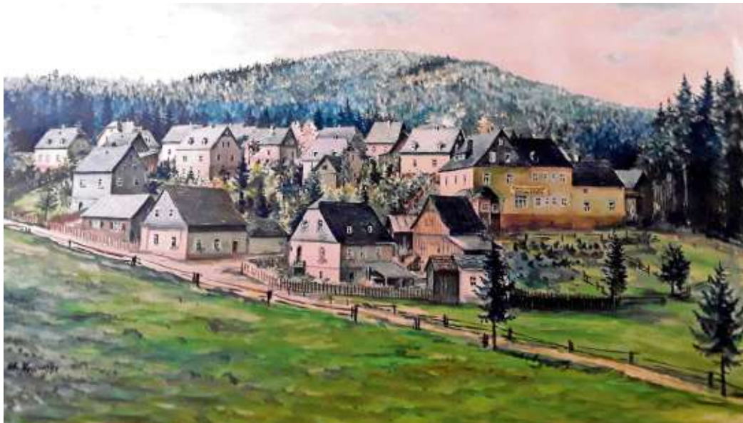
Der Jubiläums-Jahreskalender 2021 zu „100 Jahre Silberstein“ zeigt auf dem Deckblatt ein vom Geroldgrüner Karl Löhner geschaffenes Gemälde, das den heutigen Ortsteil Silberstein im Jahre 1951 zeigt.