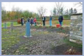
Planzaktion des OGV Marxgrün: Bunte Farbklecke am Friedhof Seite 10