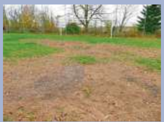
Sorgen beim TSV Lichtenberg: Larven verwüsten Sportplatzrasen Seite 15