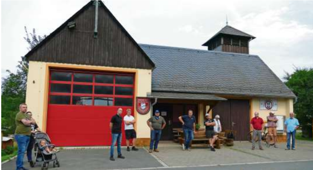
Das Feuerwehrgerätehaus wird in die Pläne der Dorferneuerung aufgenommen. Es soll aufgewertet werden und einen ordentlichen Versammlungsraum erhalten.

An einem Ortsrundgang mit Architektin Susanne Augsten aus Naila im vergangenen Monat hatten über 50 der 172 Einwohner des Berger Ortsteiles Gottsmannsgrün teilgenommen und ihre Vorstellungen und Kritiken vorgebracht. Diese hatte Augsten in den Plan zur Dorferneuerung eingearbeitet und nun auf der Bürgerversammlung im Mehrzweckgebäude in Berg vorgestellt. Neu in die Pläne der Dorferneuerung wurde die Neugestaltung und energetische Sanierung des Feuerwehrgerätehauses aufgenommen. „Es soll ein ordentlicher Versammlungsraum für die Gottsmannsgrüner entstehen, nicht mehr und nicht weniger“, erläuterte Bürgermeisterin Patricia Rubner und traf auf „offene Ohren“ bei den Feuerwehrverantwortlichen. Die Dorferneuerung startet nach den notwendigen Bauarbeiten im Untergrund mit Verlegen von neuen Wasser- und Abwasserleitungen und wohl auch Leitungsverlegung für ein Nahwärmenetz „Dorfheizung Gottsmannsgrün“.