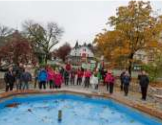
Letzte Kurgastwanderung 2020 beim Frankenwaldverein Bad Steben Seite 13