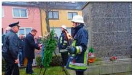
Reiner Feulner Erster Bürgermeister