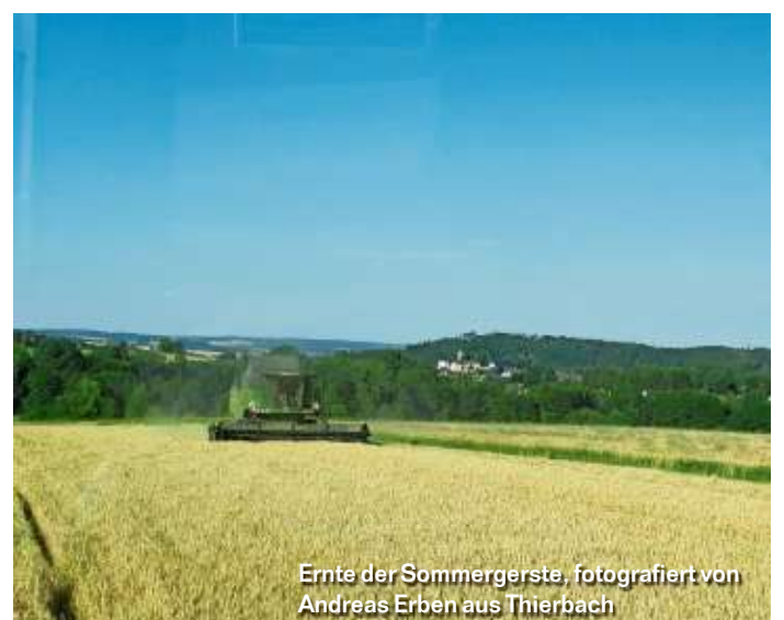
Ernte der Sommergerste