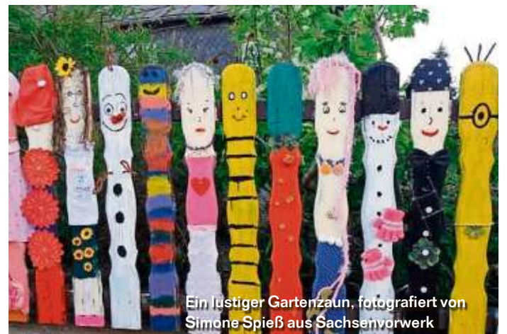
Ein lustiger Gartenzaun