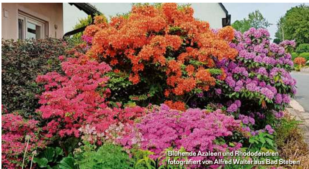
Blühende Azaleen und Rhododendren