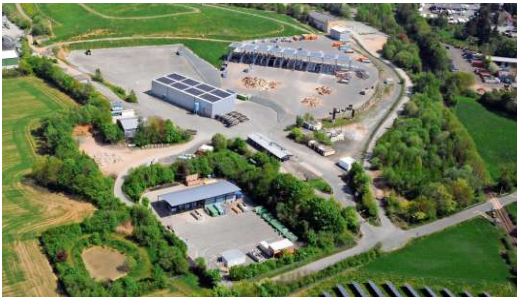
Ein Luftbild Deponie AbfallServiceZentrum aus dem Jahr 2018.

So entstanden 1992 bis 1994 acht Wertstoffhöfe. Das Wertstoffmobil tourte 1992 erstmals durch die Gemeinden des Landkreises Hof. Neben der mobilen Problemabfallsammlung entstand 1992 eine stationäre Sammelstelle am Wertstoffhof Hof. In Kooperation mit örtlichen Landwirten wurden ebenfalls 1992 neun Kompostanlagen zur Kompostierung von Grüngut und zum Teil Bioabfälle gebaut. 1995 war die Biotonne flächendeckend eingeführt. Der AZV