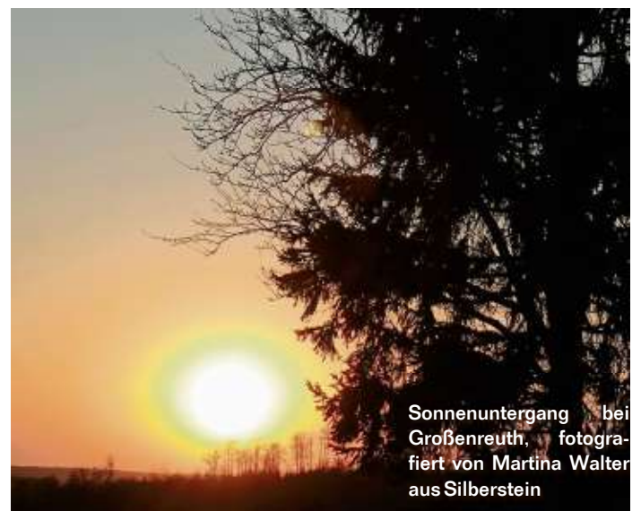
Sonnenuntergang bei Großenreuth, fotografiert von Martina Walter aus Silberstein