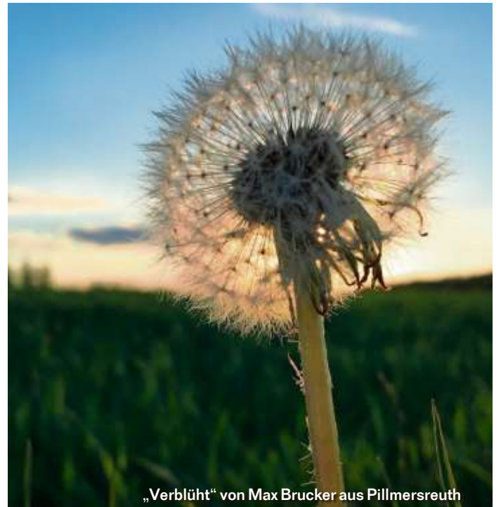
„Verblüht“ von Max Brucker aus Pillmersreuth