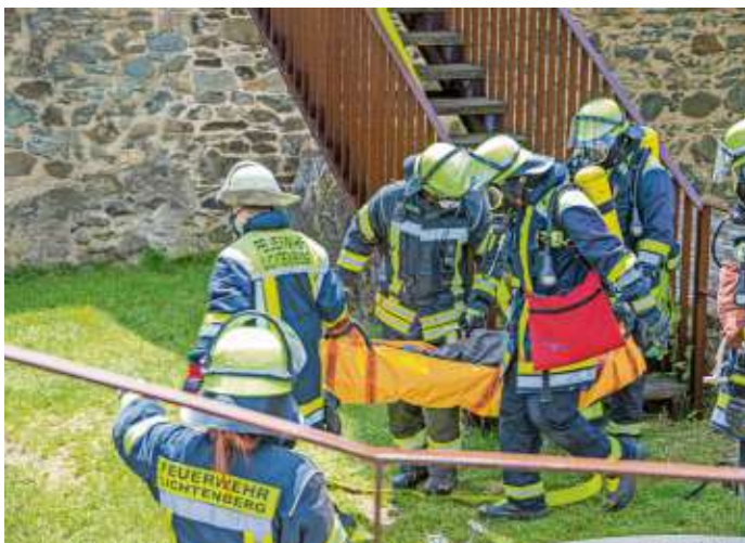
Die Atemschutzgeräteträger mussten die Person aus dem engen Turm mit einem Tragetuch retten.