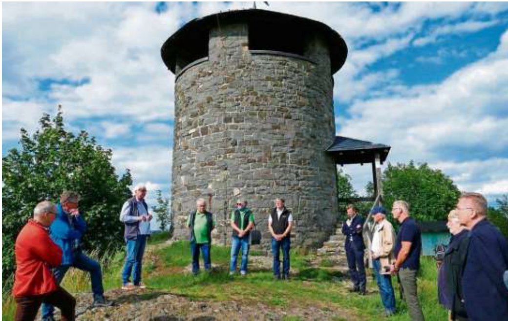
Unser Bild zeigt die Akteure rund um das Projekt Innenraumneugestaltung des Aussichtsturmes Frankenwarte auf dem Hirschhügel oberhalb des Geroldsgrüner Ortsteiles Hirschberglein, der im Besitz des Frankenwaldvereines ist.

sam mit Obmann Konrad die finanziellen Voraussetzungen geschaffen. Die Familien Menger und Hüttner aus Hirschberglein traten dem Frankenwaldverein eine nahezu 2.000 Quadratmeter große Fläche kostenfrei ab. Am 8. Mai 1939 begann der Bau und bereits am 15. Juli konnte Richtfest gefeiert werden. Mitglieder der Frankenwaldvereinsortsgruppe Geroldsgrün trugen mit Hand- und Spanndiensten zu einem zügigen Baufortschritt bei. Aber bedingt durch den 2. Weltkrieg gab es einen Baustopp und das Projekt Frankenwarte wurde erst im August 1946 wieder aufgenommen. Am 12. August 1951 erfolgte die offizielle Einweihung. Den Blick in die Geschichte des Aussichtsturmes gab der Vorsitzende des Frankenwaldhauptvereins Dieter Frank, der auch an das Werden und Wachsen der Neugestaltung des Innenraums erinnerte, dessen Planung 2016 begann. Die Panoramatafeln regte übrigens der frühere Geroldsgrüner Bürger-