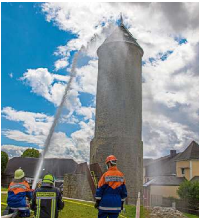
Ein Löschtrupp bekämpfte den Brand von außen mit einem mobilen Wasserwerfer.