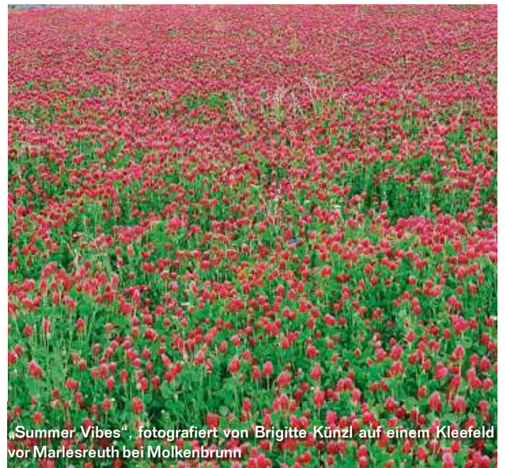
„Summer Vibes“, fotografiert von Brigitte Künzl auf einem Klee- feld vor Marlesreuth bei Molkenbrunn