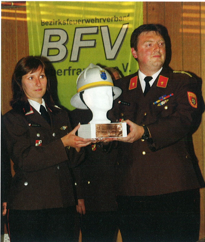
Zur Erinnerung an 40 Jahre Jugendgruppe ein Helm von „damals“ von der befreundeten Wehr aus Baden Stadt