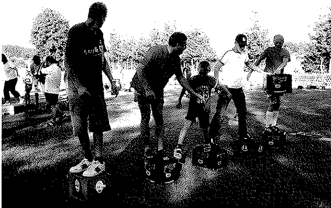
Die Mitglieder von der Feuerwehr Reitzenstein beim Kastenlauf

Die Platzierungen: 1. Platz Hauswiese 2. Platz VfL-Jugend 3. Platz Feuerwehr Issigau 4. Platz Staubige Brüder 5. Platz FW Reitzenstein 6. Platz TIM mit „Schneewittchen und die Sieben Zwerge“ (Theatergruppe Issigau Marxgrün) 7. Platz VfL Luder 8. Platz Juventus 06/07