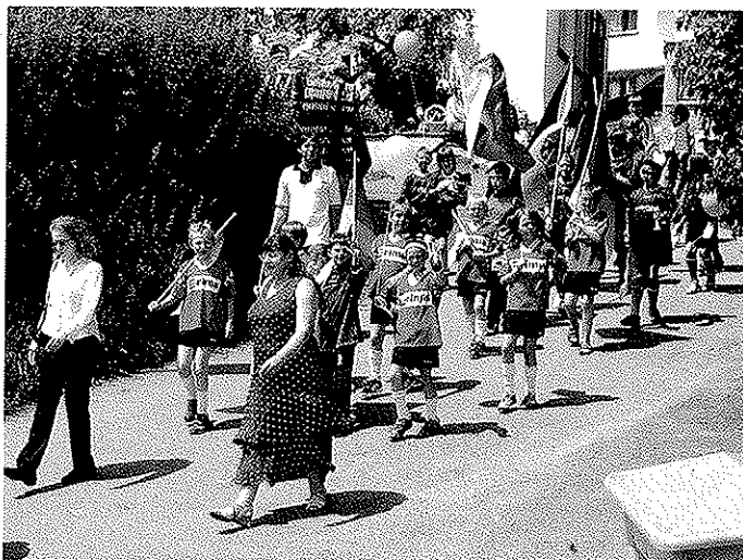
Mit zahlreichen Deutschlandfahnen, die Nachwuchskicker des VfL