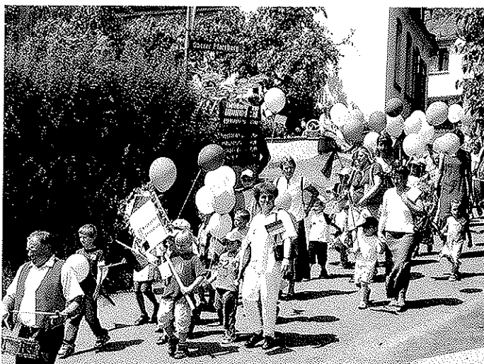
Die Kindergartenkinder präsentierten sich mit ihren vielen bunten Luftballons