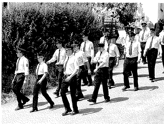
Stark vertreten die Kameraden der drei Ortswehren