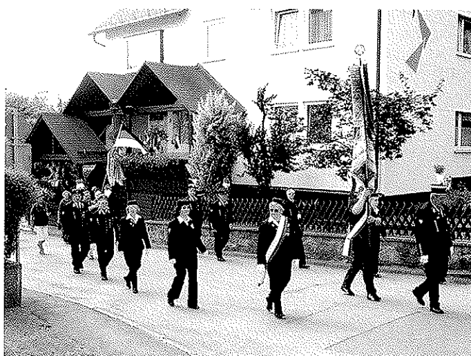
Die Abordnung der Bergknappen