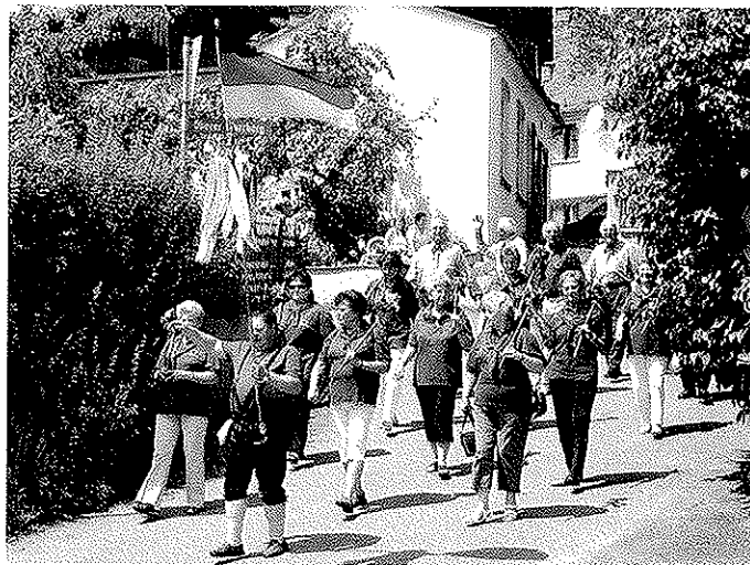
Die Abordnung der Ortsgruppe des Frankenwaldvereins mit Wimpelträger