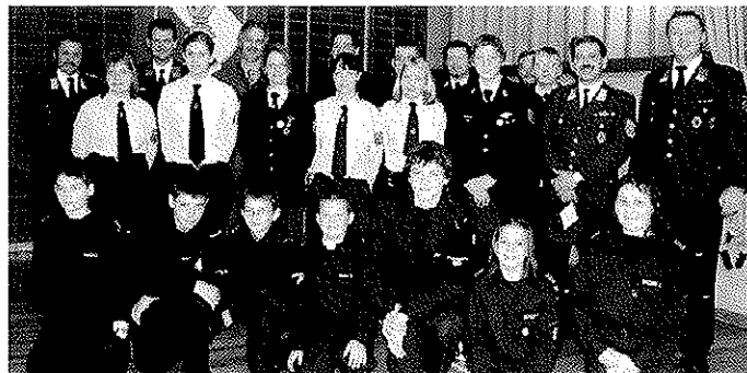
Die Jugendlichen der Feuerwehren Issigau und Baden-Stadt mit den Führungsdienstgraden der beiden Feuerwehren, nach der Eröffnungsfeier.

Es waren vier erlebnisreiche Tage in denen die Feuerwehranwärter der Issigauer und Badener Feuerwehr ihre Partnerschaft pflegen konnten.