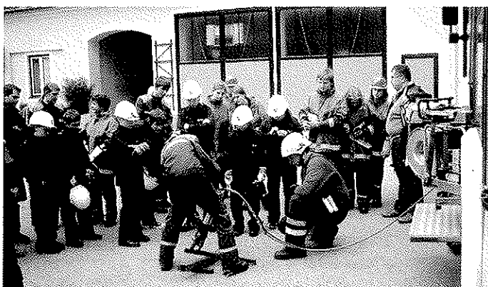
Gemeinsames Üben für das Leistungsabzeichen Technische Hilfeleistung der NÖ Jugendfeuerwehren.